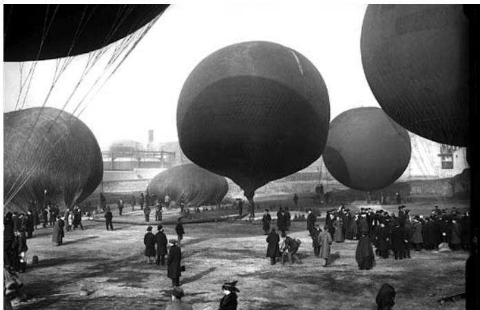
"Marín, Concurso de globos en Madrid, 1913"