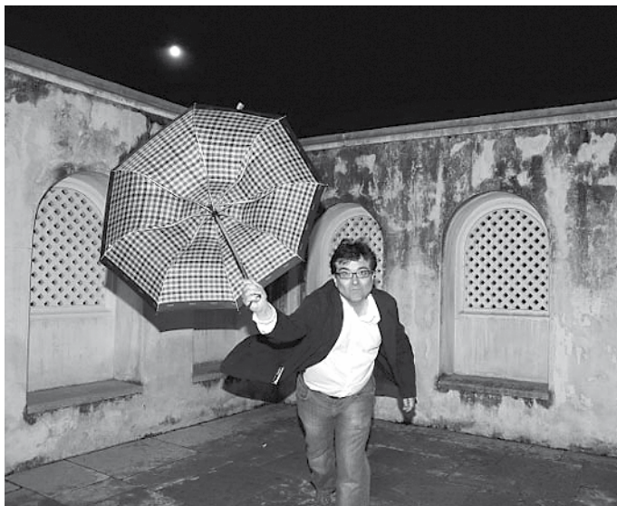
Javier Cercas